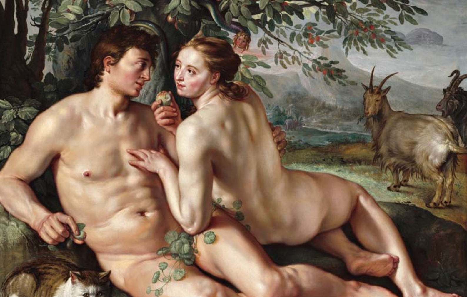
חווה מפתה את אדם לאכול מהתפוח. ציור של הנודיק גולציוס, 1616